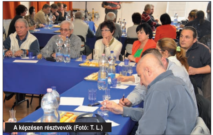
A képzésen résztvevők

mereteket kapjanak a pálinkák, a gyümölcs- és borpárlatok érzékszervi minősítéséről, fajtajellegéről, a cefrézés és a pálinkafőzés minőségjavító lehetőségeiről, a pálinkák szakszerű bírálatáról, melyet a gyakorlatban hasznosítani tudnak, ismereteik elmélyülhetnek, érzékszervi bírálatuk finom-