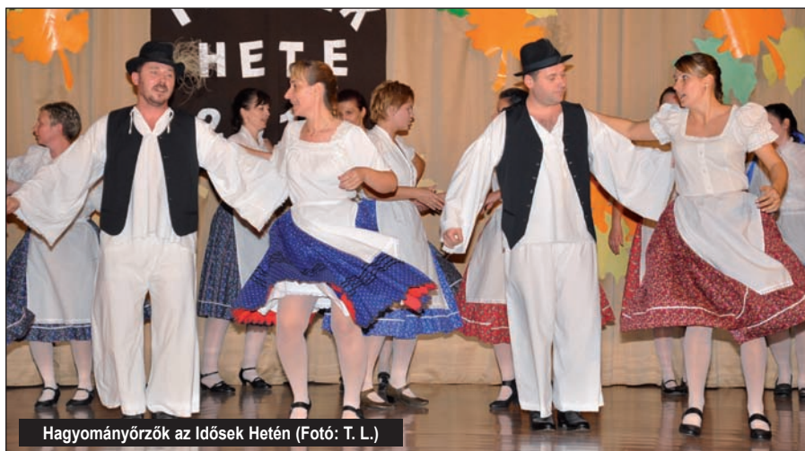
Hagyományőrzők az Idősek Hetén