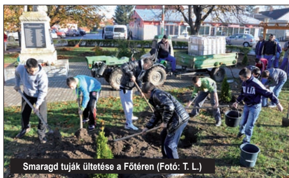
Smaragd tuják ültetése a Főtéren