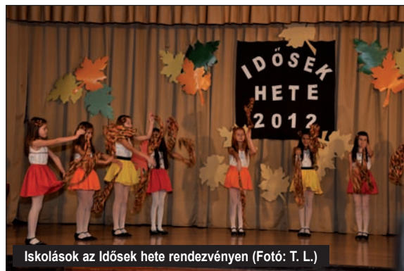
Iskolások az Idősek hete rendezvényen

A hagyományosan november végére tervezett Szép magyar beszéd és a Szépen szólj! versenyeket december 1-én rendez-