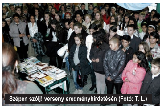
Szépen szólj! verseny eredményhirdetésén