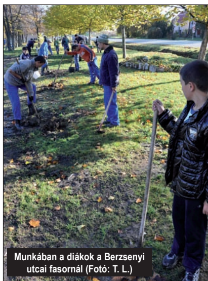
Munkában a diákok a Berzsényi utcai fasornál