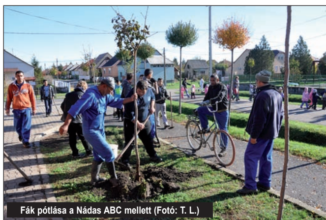
Fák pótlása a Nádas ABC mellett