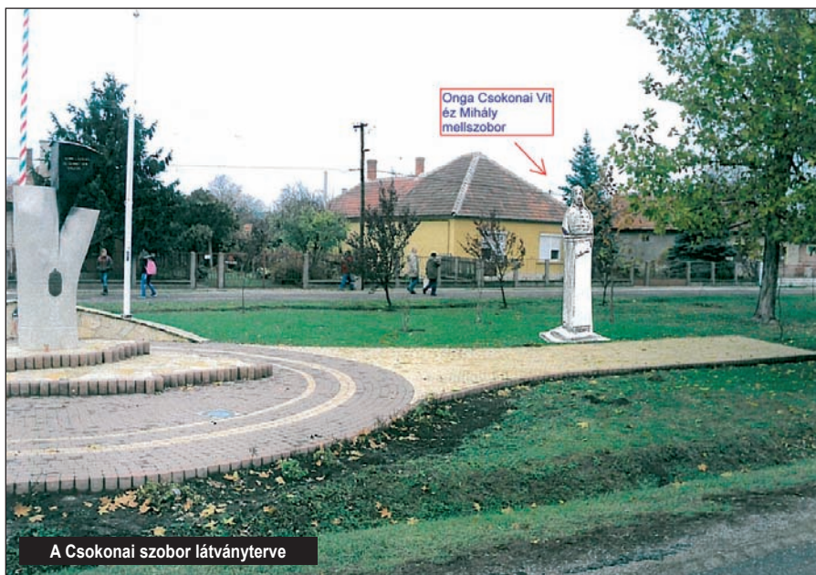
A Csokonai szobor látványterve