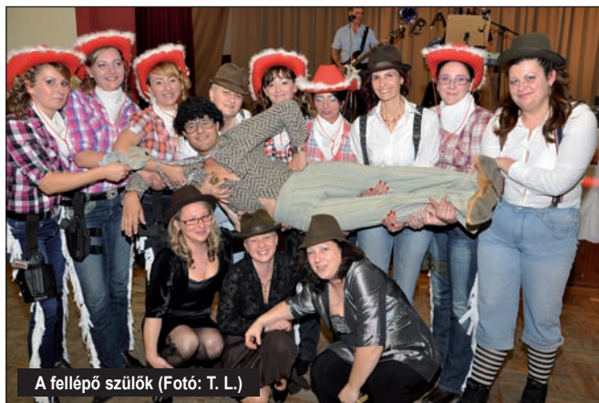
A fellépő szülők