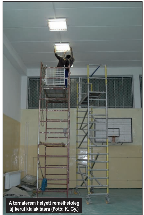
A tornaterem helyett remélhetőleg új kerül kialakításra

Onga Nagyközség Önkormányzati Képviselő-testülete a KEOP-2.1.2/2F/09-11-2011-0002 azonosító számú „Onga-Ócsánálós árvízvédelmi fejlesztése” című projekt megvalósításához kapcsolódó „Vállalkozási szerződés Onga-Ócsánálós árvízvédelmi fejlesztésének tervezési, kivitelezési munkálataira vonatkozóan, PIROS FIDIC könyv