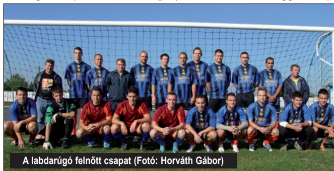
A labdarúgó felnőtt csapat

Természetesen a bajnokság végeztével nem álltunk le a pályamunkákkal. A center pályát beszórtuk fűmaggal, majd