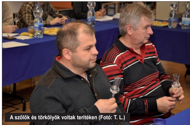
A szőlők és törkölyök voltak terítéken