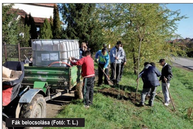
Fák belocsolása