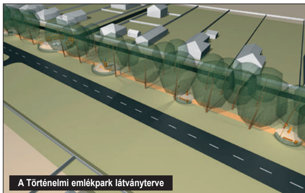
A Történelmi emlékpark látványterve

– A meglévő állapotot vizsgálva az körvonalazódott ki, hogy 3 kisebb teresedés fűzhető fel a sétányra: a bolt mögötti és a trafóház melletti kis térrész, ahol egy kis piac is ki van már alakítva; a Deák