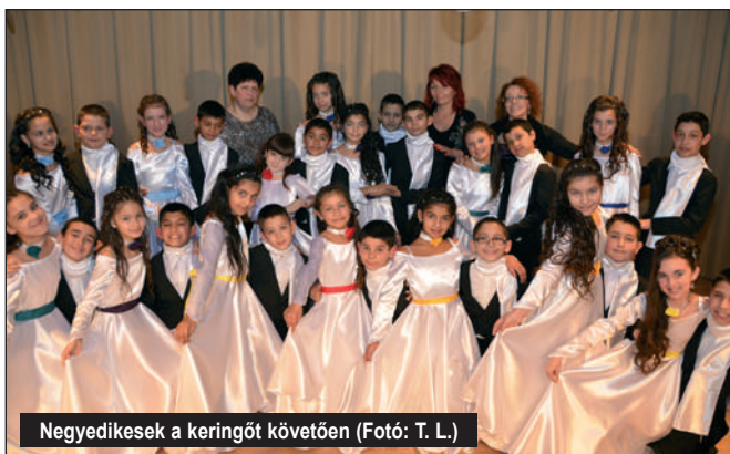
Negyedikesek a keringőt követően