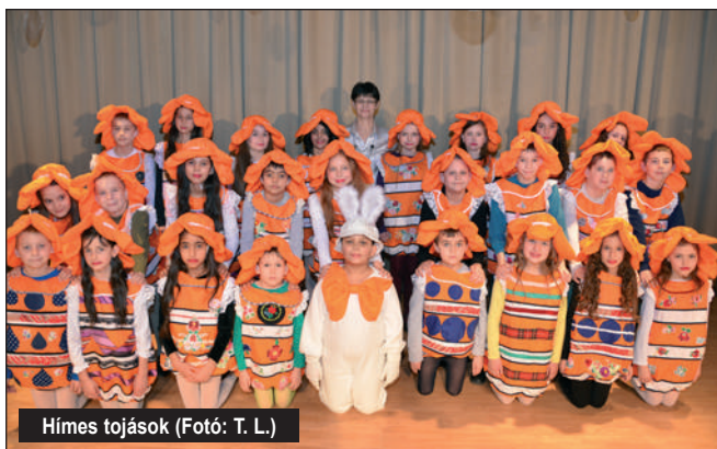
Hímes tojások