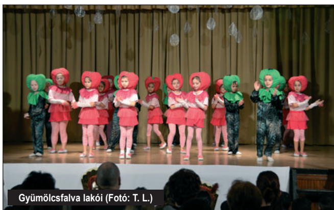
Gyümölcsfalva lakói