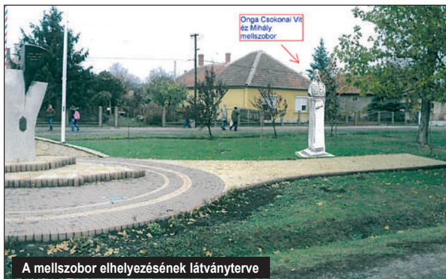
A mellszobor elhelyezésének látványterve