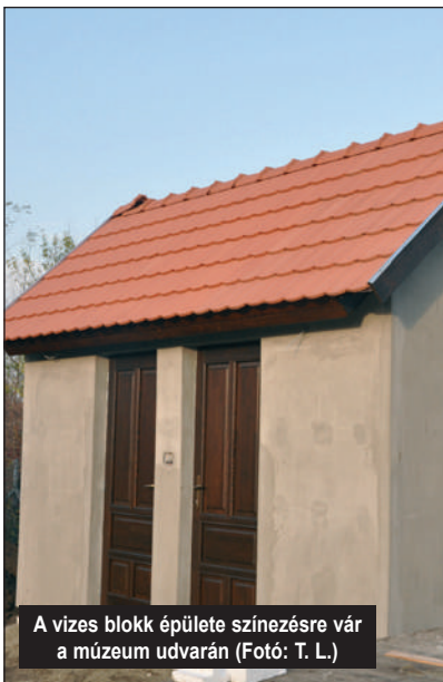
A vizes blokk épülete színezésre vár a múzeum udvarán

Az eddigi felajánlásokat, támogatásokat az egyesület vezetősége ezúton is köszöni, és továbbra is számít rájuk!