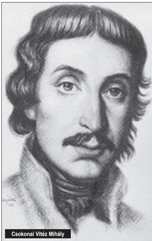
Csokonai Vitéz Mihály