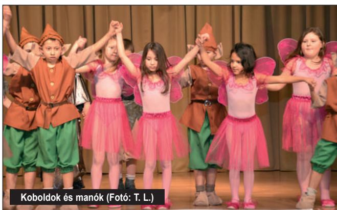
Koboldok és manók