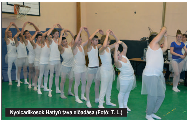
Nyolcadikosok Hattyú tava előadása