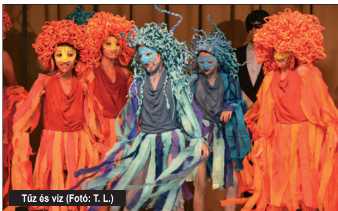
Tűz és víz